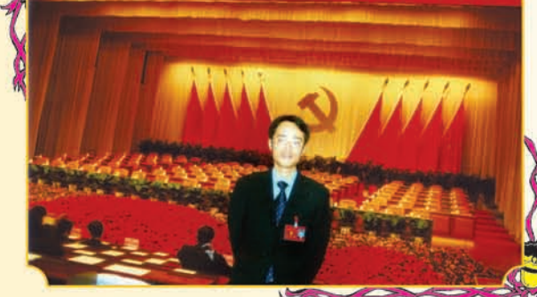
为省属国有企业“优秀共产党员”等多项荣誉。