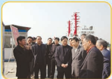
国家建设部副部长仇保兴(右三) 福建省副省长苏增添(右四)

2007年1月31日上午,国家建设部副部长仇保兴在福建省副省长苏增添等一行陪同下,来到福州新港码头现场参观调研指导工作,曾炳峰总经理热情接待了来港参观人员,并在现场对码头发展建设情况及未来远景规划作了详细的介绍。